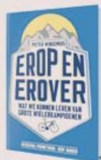
Erop en erover. Wat we kunnen leren van grote wielersportkampioenen. Pieter Winsemius, Prometheus/Bert Bakker, 304 blz., € 19,95.