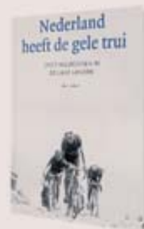
Nederland heeft de gele trui. Over wielrennen in de Lage Landen. Benjo Maso, Atlas Contact, 456 blz., € 24,99.