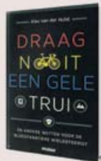
Draag nooit een gele trui en andere geboden voor de bloedfanatieke wielersporters. Alex van der Hulst, Nieuw Amsterdam, 206 blz., € 17,95.